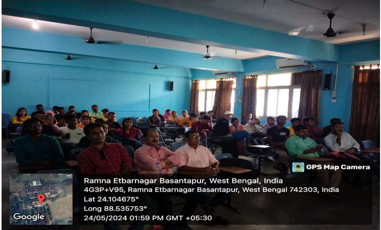
চিত্র-৩ আলোচনায় শ্রোতা হিসেবে সম্মানীয় অধ্যাপক এবং ছাত্র ছাত্রী