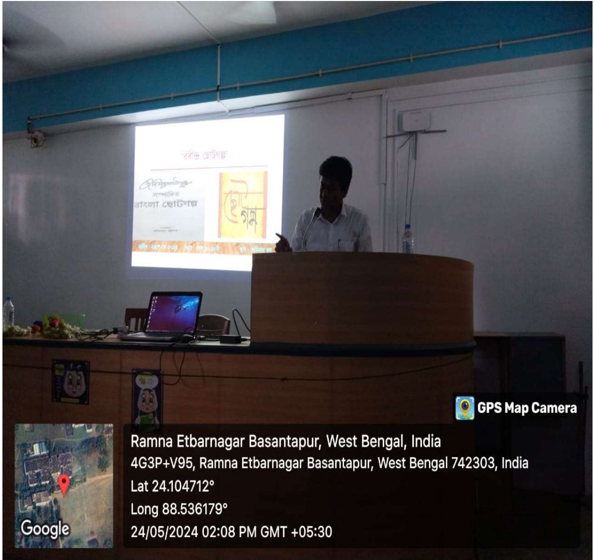
চিত্র-২. আলোচনার মুহূর্ত